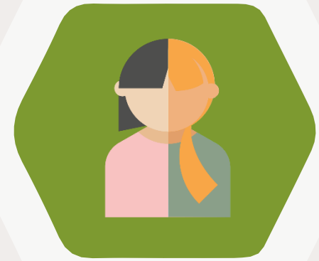
Mentor*in aus Organisation B