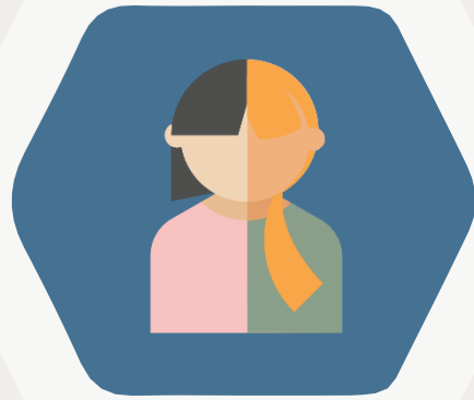
Mentee aus Organisation A

Eine junge Führungskraft erhält eine Mentor*in aus einem anderen Unternehmen: